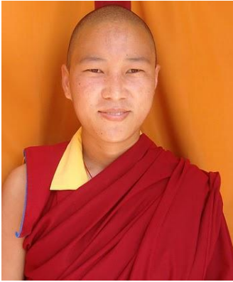
ཞེས་བརྩུན་མ་ལྷ་མོ་ཚོས་སྤྲིད་ནས་བྲིས་བ་དགའོ། །

བདག་འདྲའི་སློང་མན་ཚོས་ཀྱི་གྲོགས་རྣམས་ལ། ། བདག་སློང་ཤར་བའི་ཚོས་ལ་བསྐྱེལ་བའི་གཏམ། ། ཡན་པའི་རེ་སློབ་དད་གུས་སློབས་སུལ། །