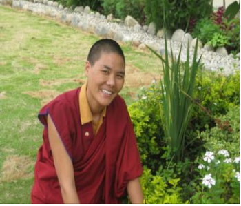
ཅེས་གྲུས་མོ་ཀློང་ཚོས་འདོམས་ནས་ཉེན་བཟང་པོར་བྲིས་པ་

བདག་གི་རྩ་བའི་སློབ་མ། ། དུས་དང་རྣམ་པ་ཀླན་ཏུ། ། རྒྱུན་པར་བར་ཚད་མེད་པར། ། སྐྱ་ཚོ་ཞབས་པད་བརྟན་གོག་༥། རྒྱུན་སྐྱོད་བདག་གིས། ། སློབ་མ་དྲན་པའི་གདུང་དབྱངས། ། བེད་ཀྱི་ལུང་ལུང་ལུང་ལུང་།