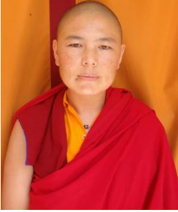
ཅེས་བཅུན་མ་དམ་ཚོས་ལྷོ་མོ་ནས་སྐྱུར་བ་དགའོ།། །།

སྐྱི་ཡི་དོན་དུ་སྐྱེར་དོན་རྩལ་ལྟོང་། ། དམངས་ཀྱི་བདེ་སྐྱབས་ཉེན་མཚན་ཀླན་དུ་བྲན། ། ཀླན་ལ་བྱམས་བཟུང་འོད་གྱིས་སྐྱོང་མཛད་པའི། ། ང་ཡི་སློབ་མ་ཚོས་དཔལ་བཟང་པོར་འདུད།།༡། བདག་དང་གཞན་ལ་ཁྱད་པར་ཡོད་མིན་ཞེས། ། རྒྱལ་བའི་བཀའ་སྐྱོད་སྐྱོང་བས་དྲན་བྱས་ནས། རང་གི་འདོད་དོན་ལོ་ན་མ་གཡང་སྤངས་པར། ། སྐྱི་ཚོགས་ཕན་བདེ་སྐྱབས་ལ་འབད་པར་གྱིས།༥ ། གཞན་ཕན་བྱམས་བཟུང་འོད་རྒྱ་རྒྱན་མ་ལུས་པ། ། གཙོག་འདུས་སྐྱི་ཚོགས་ཕན་བདེའི་རྒྱ་མཚོ་ཆེར། ། འབྱེད་པའི་འབྲུང་འབྲུང་སྤངས་པར་བརྟན་ཚོས་ལུགས་གྱི། ། གངས་དཀར་ལྷན་པོའི་གཟི་ཉམས་རྒྱས་ལྷུང་ཕྱིག་༥ ། རྩོད་རྒྱུ་ལུན་པའི་དཔུང་ཚོགས་མཐར་སྐྱོད་པའི། ། ཁྲིམས་སྐྱོལ་གཙང་མའི་རྟ་བུན་འོད་མདངས་གྱིས། །